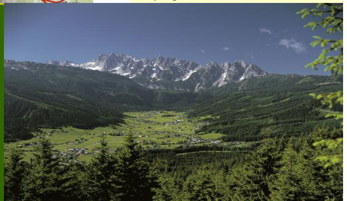
Gosautal mit Gosaukamm

Weitere Informationen erhalten Sie beim Tourismusverband Inneres Salzkammergut unter Tel.: +43 (0)6136 8295